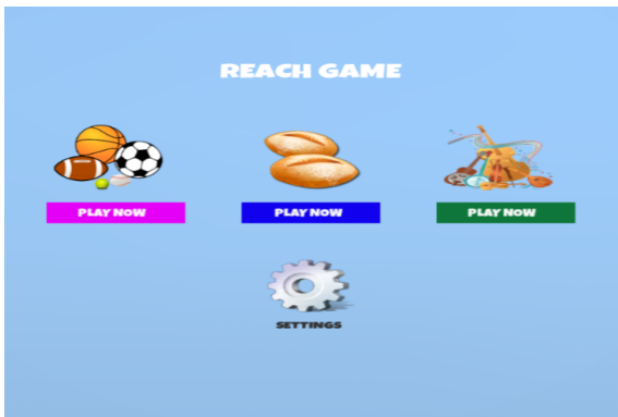
Figure 1: Juego del alcance: Interfaz principal.