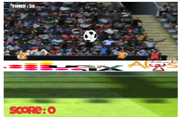
Figure 4: Captura del juego Remate.