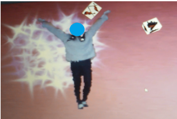
Figure 3: Captura del juego de alcance.

musicales, pan, o pelotas (ver Figura. 5). Se pueden introducir nuevos temas de manera sencilla. El fisioterapeuta sólo tiene que descargar las imágenes preferidas del paciente e indicar su ubicación en la interfaz de configuración. Por otra parte, las imágenes de fondo en ambos juegos se seleccionan para hacer sentir al usuario que está inmerso en un entorno virtual.